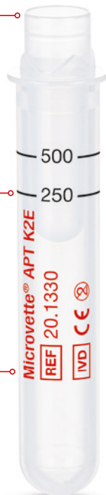
Microvette® APT 500

Analyse rapide – directe et hygiénique à partir du tube primaire. Un nouveau bouchon à membrane perforable garantit l'expédition et le transport de l'échantillon en toute sécurité.